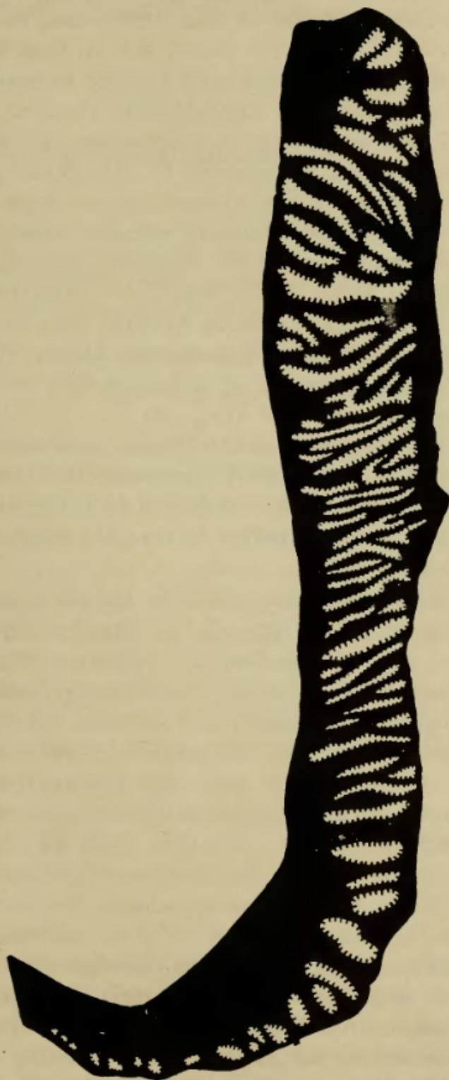
Abb. 2. Querschnitt durch den Sphincter von Epizoanthus mediterraneus CARLGR. - Original.